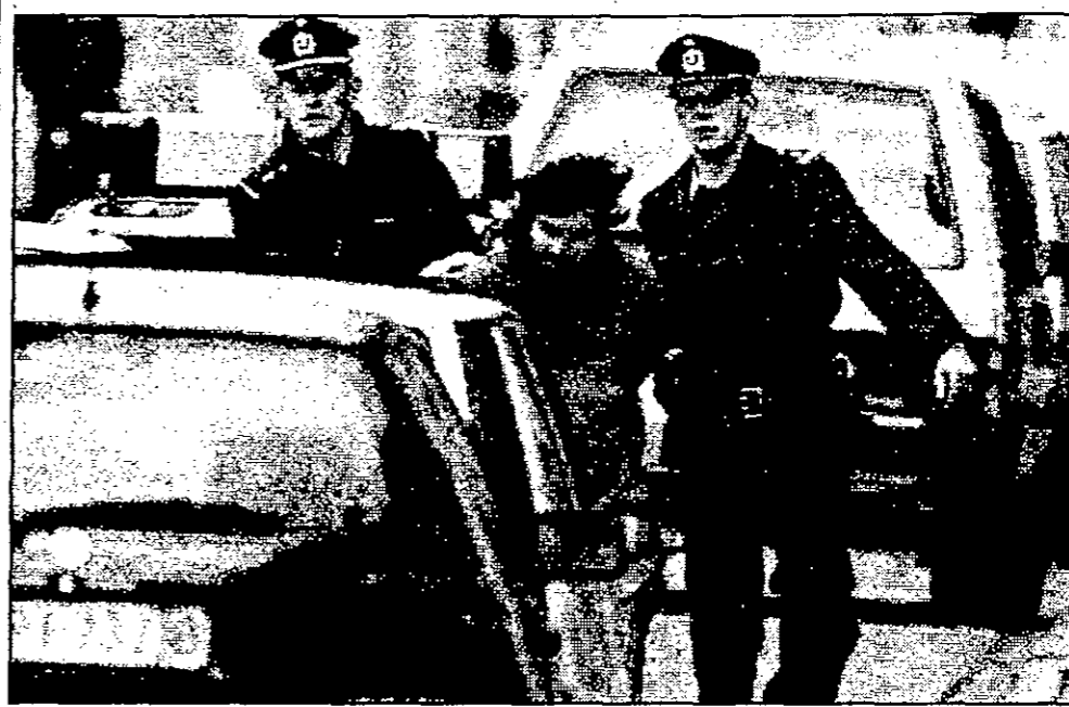
صورة من الحملة التي شنها الدرك البلجيكي الاسبوع الماضي في اوساط يشتبه ان لها علاقة بالجماعة الإسلامية المسلحة

علاقة بالجماعة الإسلامية المسلحة وبقية المشتبه بهم في هذه القضية. وقال كارتييه ان طابقي، التي كان يقدم بصفة غير قانونية في بلجيكا، وجد نفسه ضحية في شارع مورير، يدافع قضائياً معه من الآخرين. وادفع للمجموعه ان طابقي لم يكن يعرف اللؤلؤ الاسلامية ليقية افراد الجموعه ولا نشاطاتهم، التي وصفها بالاجرامية، في مجال تزوير الوثائق، وقال انهم (الآخرين) لم يكونوا يتحدثون عن نشاطاتهم في حضوره. في نفس المسيا كلف تاليزان ان اللؤلؤ البلجيكيين عثروا في البريمن للمؤمنين بشفقة شارع مورير، يحيى واتسليه على قران يمكن ان تؤكد من اعيم حول انشاء اللؤلؤ عليهم داخلها التي الجماعة الإسلامية المسلحة الجزائرية. وجاء في التقارير التي نشرت في العاصمة البلجيكية ان اللؤلؤ عليهم حولوا الشقة للتكوير الى ورشة حقيقية. لصناعة الوثائق المزورة. وادفع للمجموعه ان اللؤلؤ عثروا على منشورات تحريضية لها علاقة بالجماعة الإسلامية المسلحة، بالإضافة الى اوزار سفر ووثائق هوية اوروبية واخطام متعددة. وكشفت صحيفة لوسوار، البلجيكية الصادرة في اواس الخسيس ان الفرسان في غاية الاتساع، طلب صلح فريد ملك، للمحك عليه غاييا في فرنسا يسمع سنوات سجن. وقالت الصحيفة ان هذا الموضوع ثانوي بالنسبة للقضاء البلجيكي، ان سحقت هذا الاخير يملك الى غاية الاتساع، بل طلب صلح فريد ملك، للمحك عليه بالنسبة ليه عقب أحداث الخسيس الماضي في شقة «ايكسيل»، وتتضمن هذه التهم في العيصان والانتفاء الى جماعة اشراش والشروع في القتل باستعمال السلاح الناري، وفي ضلة التهمة الاخرى عقب اشراك ملك مع البرك البلجيكي في اقامة التونس لعروسي السوسيه عقب محاولة القبض عليه، وقالت الصحيفة بعد الانتهاء من التحقيقات، وما اذا طلبت فرنسا ملك، يمكن تسليمه لها.